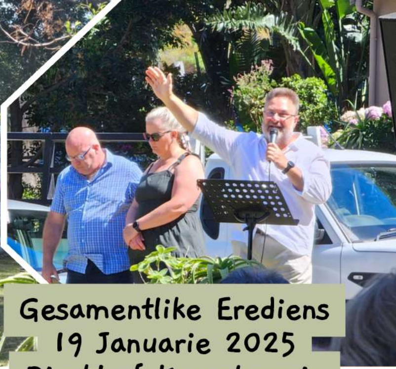
Gesamentlike Erediens 19 Januarie 2025 Disakloof Kampterrein