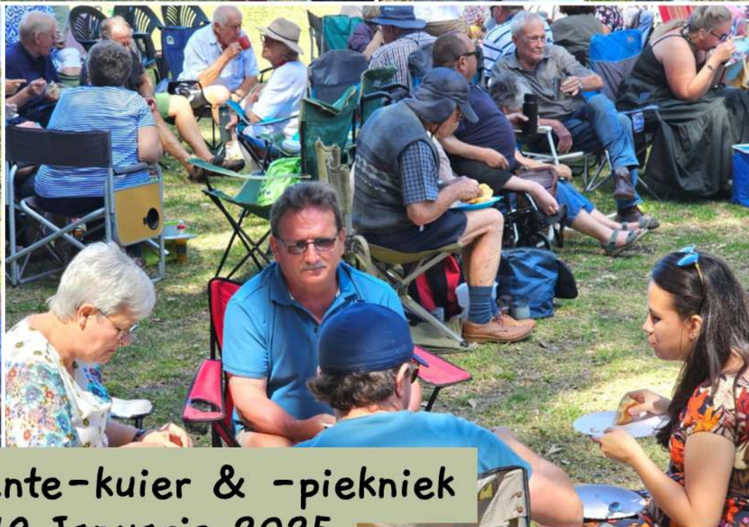
Gemeente-kuier & -piekniek 19 Januarie 2025 Disakloof Kampterrein