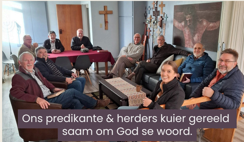
Ons predikante & herders kuier gereeld saam om God se woord.