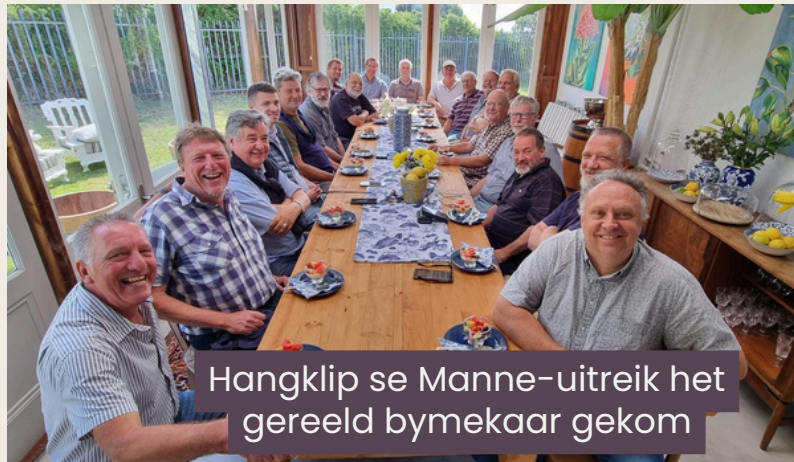
Hangklip se Manne-uitreik het gereeld bymekaar gekom