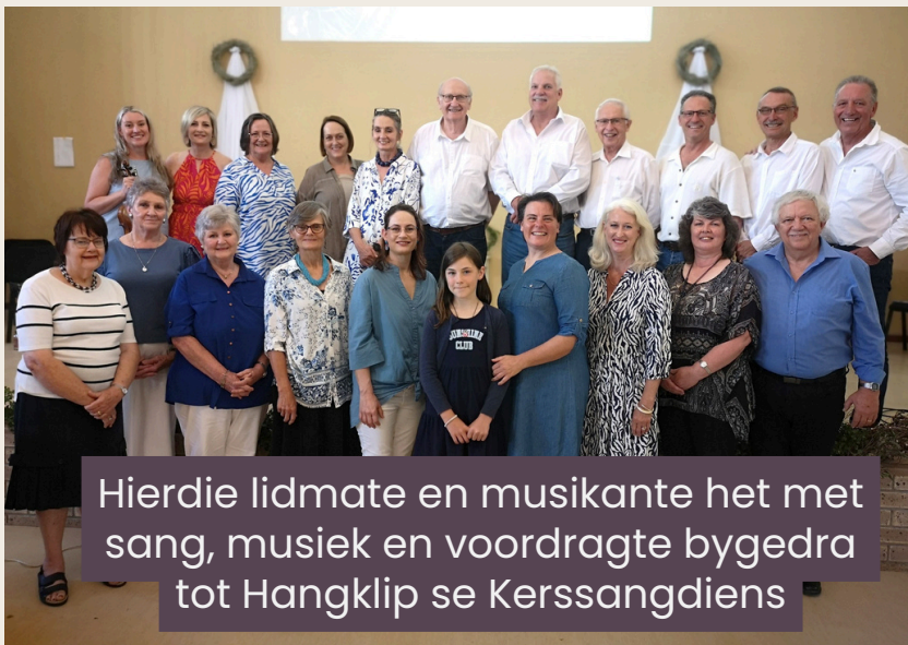
Hierdie lidmate en musikante het met sang, musiek en voordragte bygedra tot Hangklip se Kerssangdiens