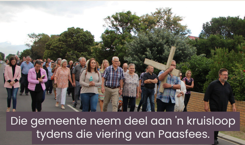
Die gemeente neem deel aan 'n kruisloop tydens die viering van Paasfees.