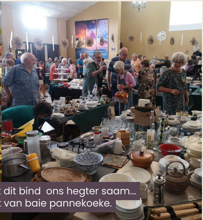
Ons hou van basaars, want dit bind ons hefter saam... en gee kans vir die eet van baie pannekoek.