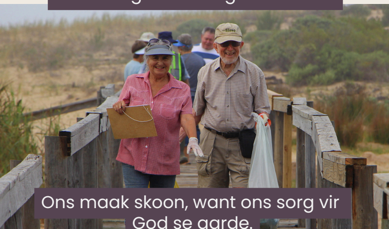
Ons maak skoon, want ons sorg vir God se aarde.