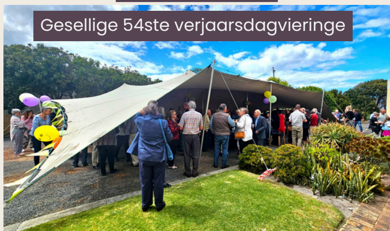
Gesellige 54ste verjaarsdagvieringe