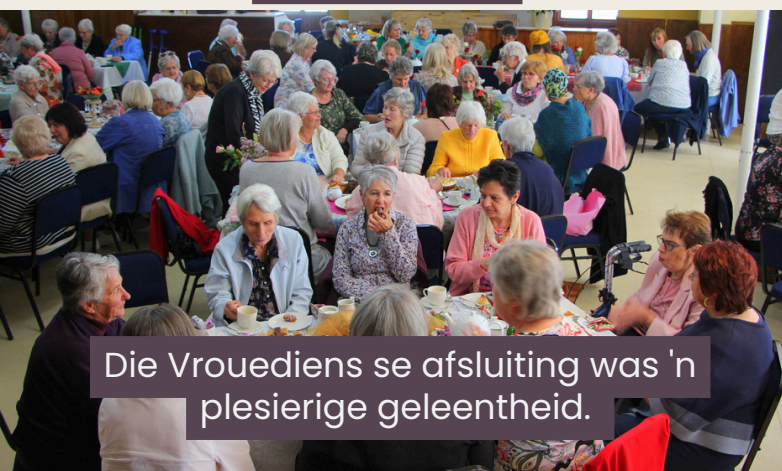
Die Vrouediens se afsluiting was 'n plesierige geleentheid.