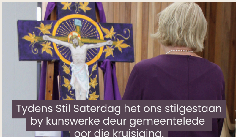
Tydens Stil Saterdag het ons stilgestaan by kunswerke deur gemeentelede oor die kruisiging.