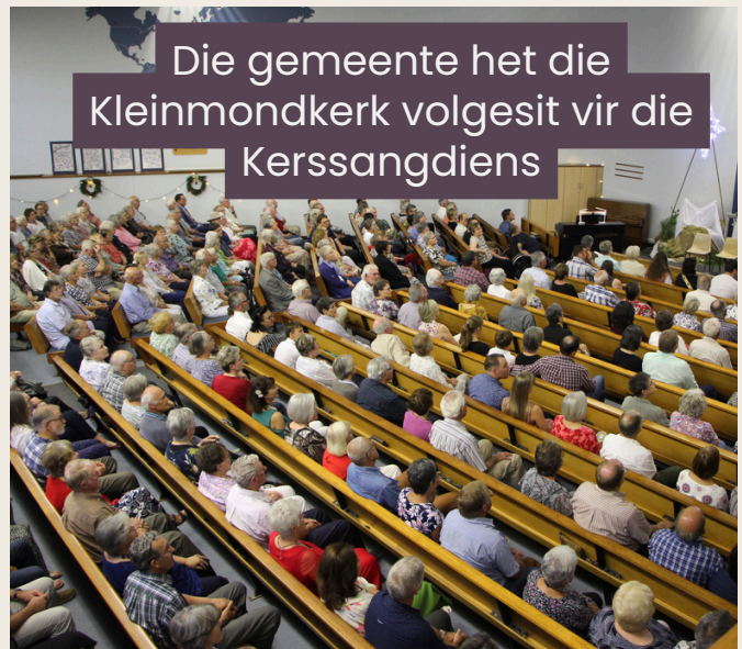
Die gemeente het die Kleinmondkerk volgesit vir die Kerssangdiens